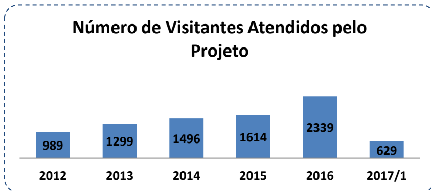
Gráfico 1 – Número de visitantes atendidos pelo projeto.